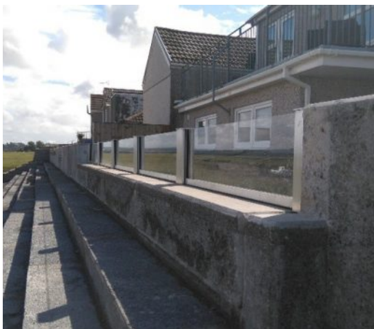
Slika 2: Primer steklenih elementov v visokovodnem zidu.

Ker so detajli za vgradnjo lamel ali steklene zaščite različne odvisne od izbire proizvajalca, detajlnejši načrti v projektu niso prikazani in jih pripravi izvajalec.